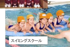
スイミングスクール